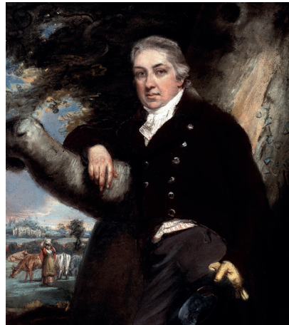
Abb. 2 und 3: Wichtige Pioniere und Wegbereiter von Impfungen: Lady Mary Wortley Montagu und Edward Jenner.