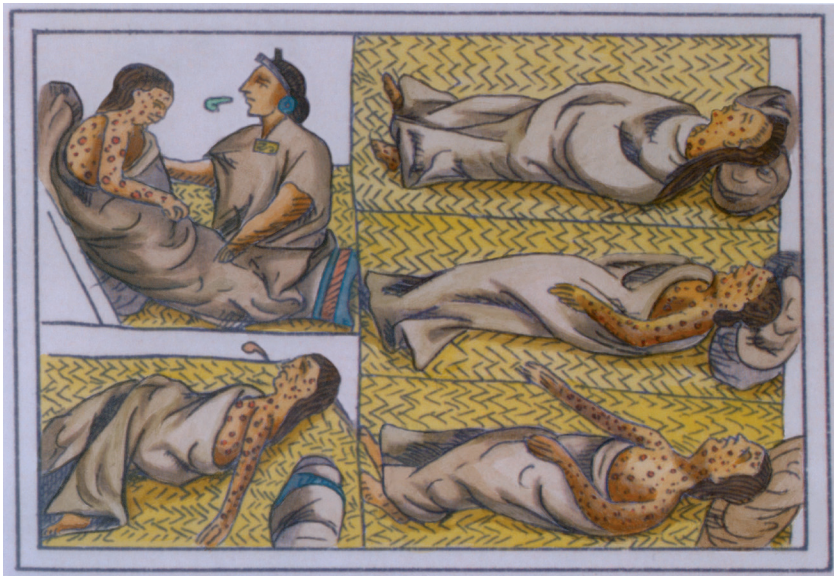
Abb. 1: Vor Einführung der Impfung im 20. Jahrhundert kosteten die Pocken rund fünf Millionen Menschen das Leben.

Es ist eine der sprichwörtlichen Erfolgsstories der modernen Welt: das Zurückdrängen jener ansteckenden Erkrankungen, die das Leben der Menschheit über Generationen hinweg begleitet haben. Heute sind viele dieser Krankheiten in den entwickelten Ländern der Erde – so auch in Österreich