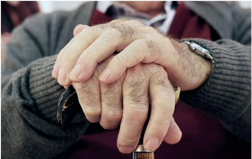
Abb. 2: Gebrechlichkeit ist ein im Alter auftretendes Bündel von Beschwerden.

Gebrechlichkeit – englisch frailty – ist eine Gesundheitsbeeinträchtigung vor allem bei älteren Menschen. Der Begriff bezeichnet einen Zustand höherer Empfänglichkeit gegenüber Krankheit und gegenüber Umwelteinflüssen. Gebrechlichkeit ist ein im Alter auftretendes Bündel von Beschwerden, das durch mehrere Symptome definiert ist. Zu diesen zählen rasche Ermüdbarkeit oder Erschöpfung, geringe Nahrungszufuhr, langsame Gehgeschwindigkeit, körperliche Schwäche und geringe körperliche Aktivität.