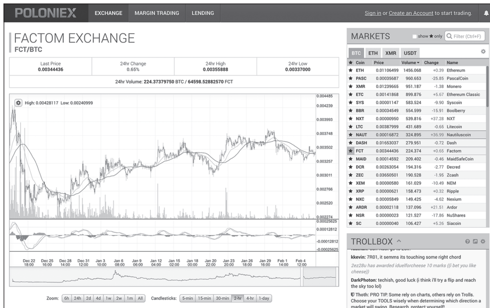
Abbildung 1.3: Die Handelsplattform Altcoin

An Kryptowährungsbörsen finden Sie viele Token dieser öffentlichen Blockchains wieder. Abbildung 1.3 zeigt beispielsweise die Altcoin-Börse für Poloniex ( https://poloniex.com ), eine Handelsplattform für Kryptowährungen.