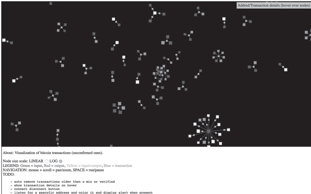
Abbildung 1.1: Der Aufbau des Blockchain-Netzwerks Bitcoin

Kryptowährungen als Anreiz zum Erhalt der Netzwerkintegrität. Viele Kryptowährungen werden wie Aktien an Börsen gehandelt.