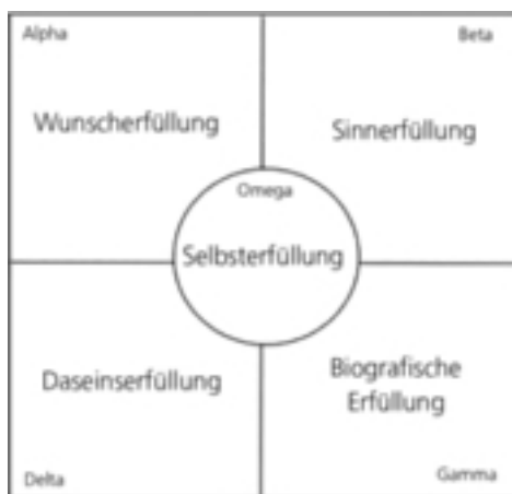
Abb. 2: Das 5-Felder-Modell eines erfüllten Lebens

Fügen wir die Ergebnisse dieses Kapitels in das Schaubild ein, siehe Abb. 2.: